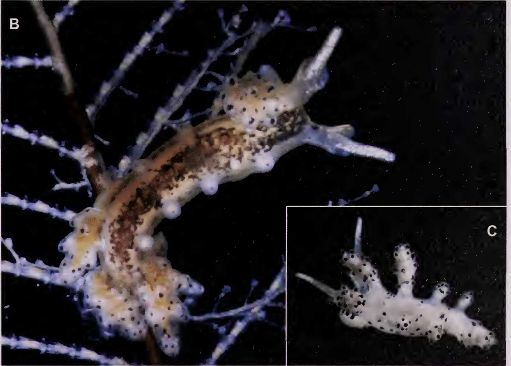
Lámina 1.- A. Doto floridicola Simrot, 1888; B. Doto koenneckeri Lemche, 1976; C. Doto furva García-Gómez & Ortea 1983.